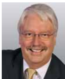
Jörg-Uwe Hahn Hessischer Minister der Justiz, für Integration und Europa