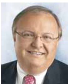
Jürgen Banzer Hessischer Minister für Arbeit, Familie und Gesundheit

Die nachfolgende Broschüre erläutert zunächst die Instrumente, mit deren Hilfe Sie selbstbestimmt vorsorgen können und stellt sodann die wesentlichen Inhalte der rechtlichen Betreuung, einschließlich des rechtlichen Verfahrens und der Aufgaben der betreuenden Person dar.